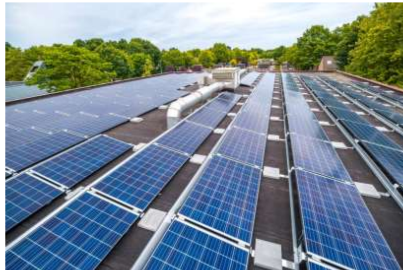
Collectief Zonnedak De Pracht